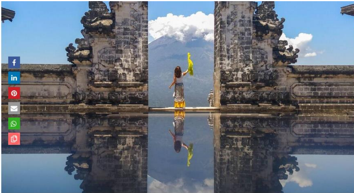
Das Gate of Heaven am Tempel Pura Lempuyang Luhur auf Bali

[Instagram vs. realitat a les Portes del Cel, Bali.]