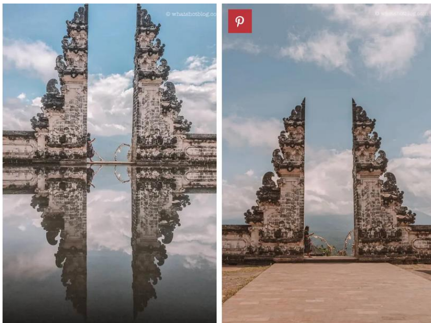
Instagram vs Reality at the Gates of Heaven, Bali.

[Instagram vs. realitat a les Portes del Cel, Bali.]