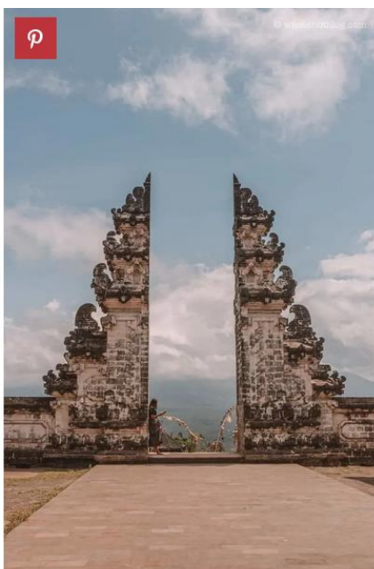
Instagram vs Reality at the Gates of Heaven, Bali.