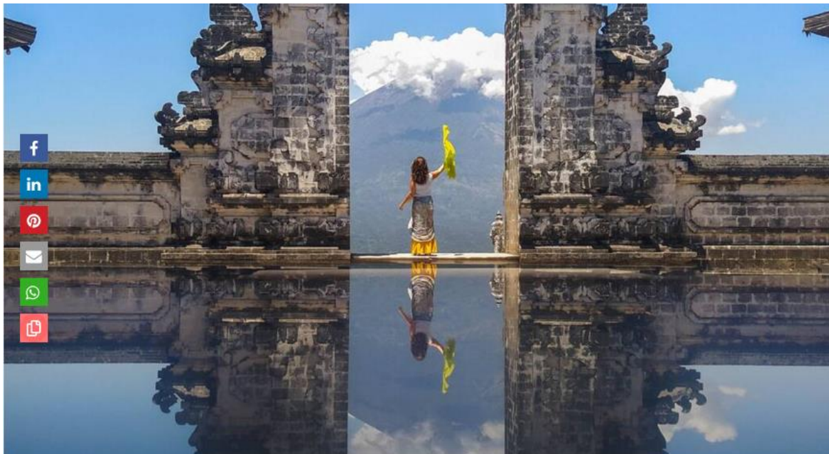
Das Gate of Heaven am Tempel Pura Lempuyang Luhur auf Bali