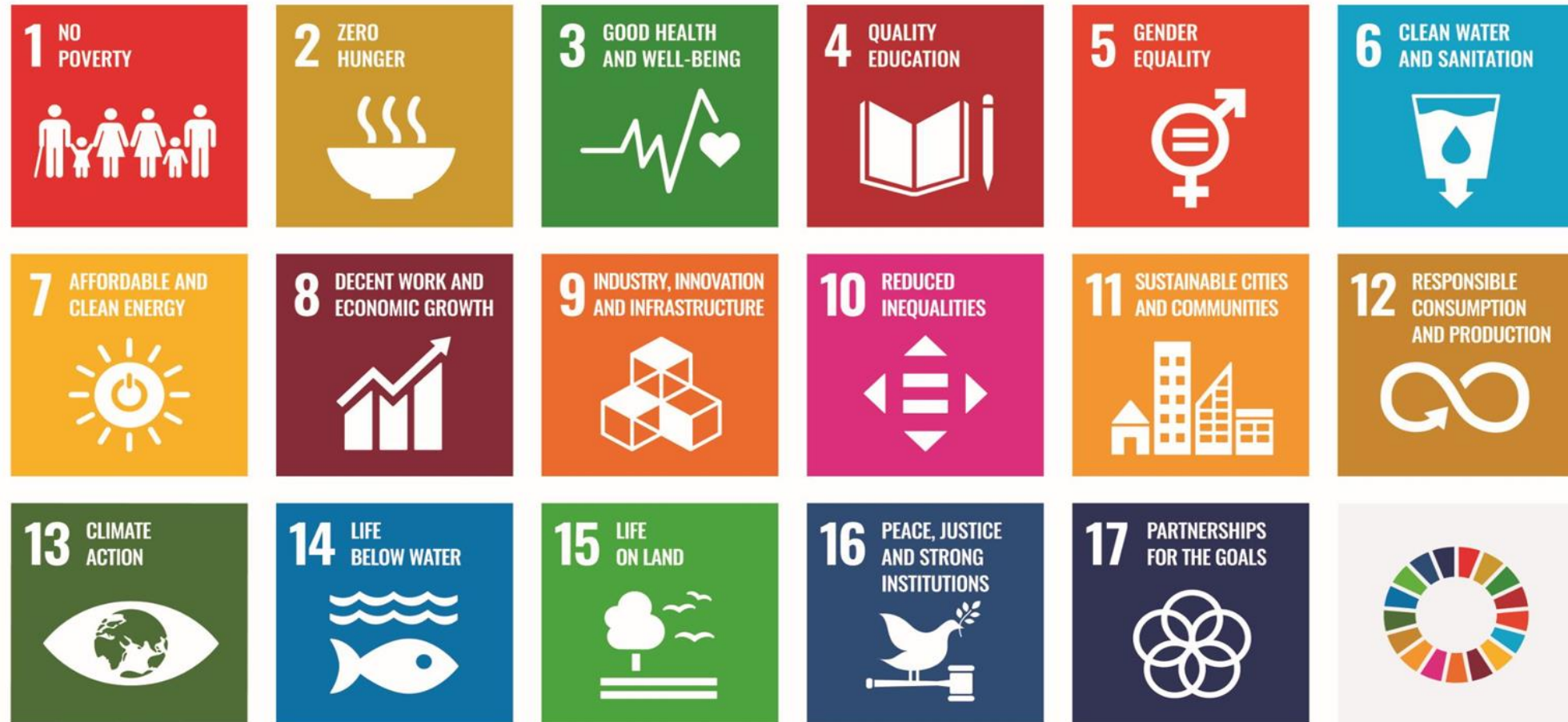
UN's 2030 Sustainable Development Goals (SDGs)