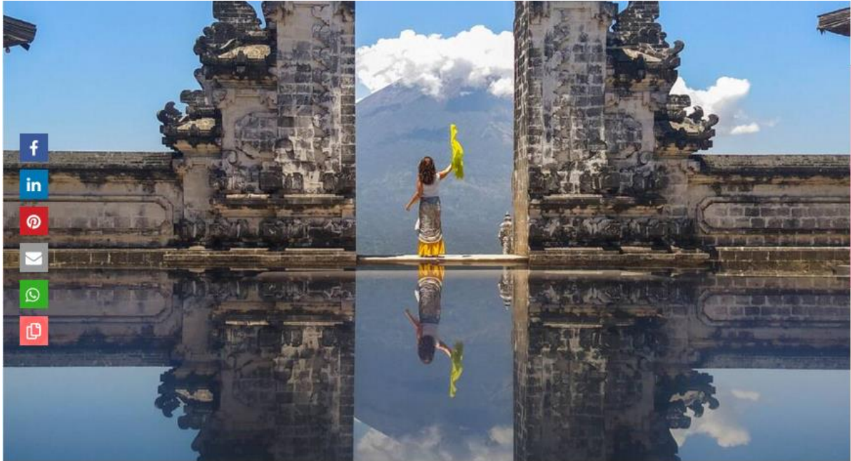
Das Gate of Heaven am Tempel Pura Lempuyang Luhur auf Bali