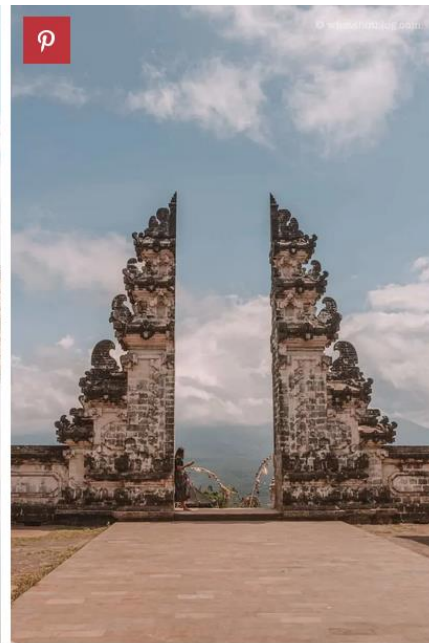
Instagram vs Reality at the Gates of Heaven, Bali.